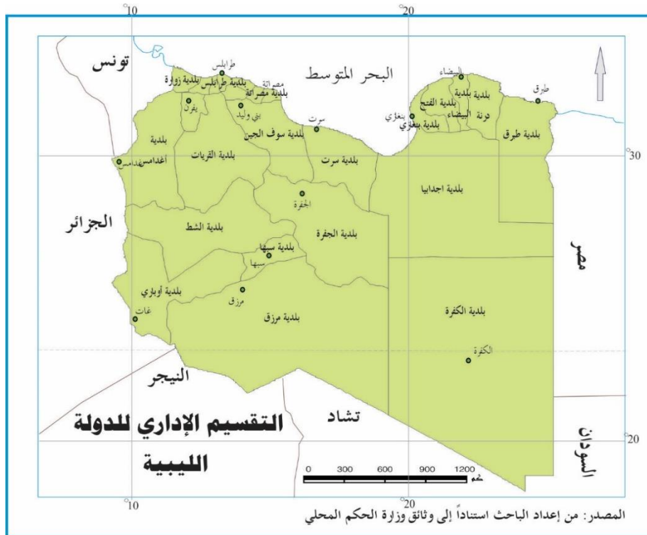
شكل ( 1 ) التقسيم الإداري للدولة الليبية

الهوية مرتبطة في اللغة بأنها مصطلح مشتق من الضمير (هو)؛ ومعناها صفات الإنسان، وأيضا تستخدم للإشارة إلى المعالم والخصائص التي تتميز بها الشخصية الفردية، أما اصطلاحا فتعرف الهوية بأنها مجموعة من المميزات التي يمتلكها الأفراد وتساهم.