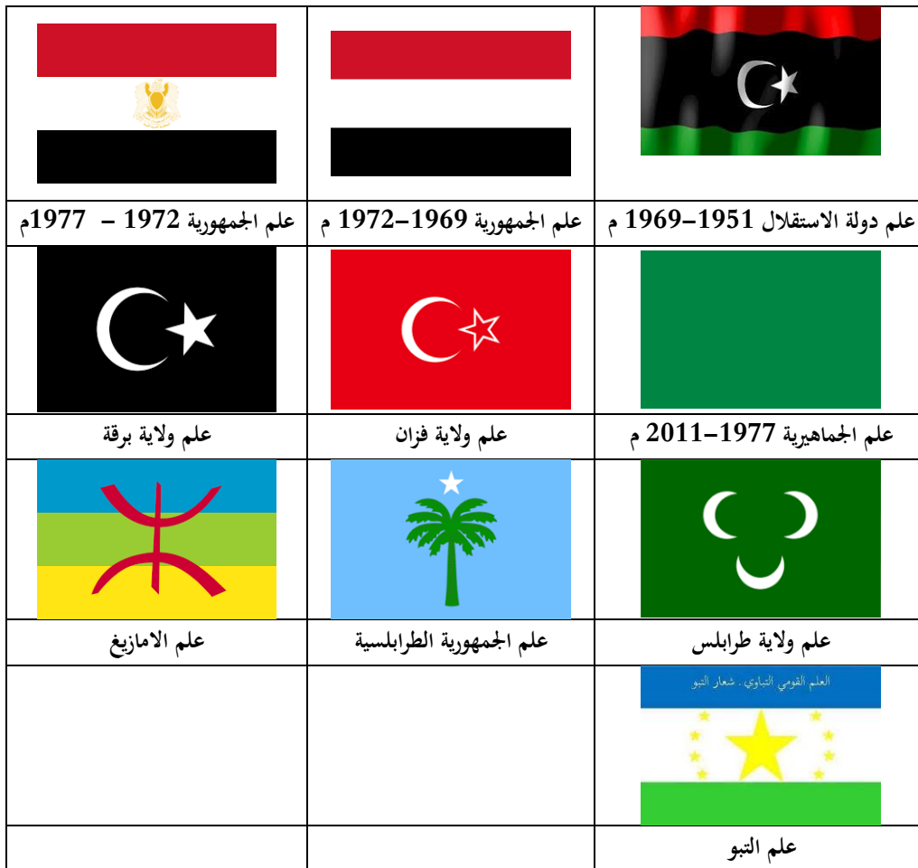
( الشكل رقم 3 )

يرمز العلم الوطني للدولة الذي من المفروض أن يمثل جميع كيانات الدولة ويجمع الجميع تحت رايته، إلا أن العلم الوطني قد تغير بتغير أنظمة الحكم التي حكمت البلاد فظهر أول علم وهو علم الاستقلال سنة 1951م ثم علم الجمهورية الليبية ثم علم الجماهيرية .